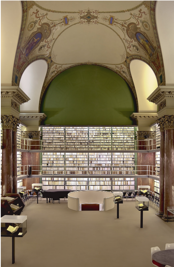
Bibliotheken, Orte der Bildung und der Wissenschaft. Im Bild die Augusteerrhalle in der Herzog August Bibliothek in Wolfenbüttel.

Herausgekommen ist eine großartige Chronik, die man sich bei der Vorbereitung ähnlicher Publikationen zum Vorbild nehmen kann. Man lernt eindrücklich, welchen Schatz die Landschaft in ihrer natürlichen und vom Menschen veränderten Vielfalt darstellt.