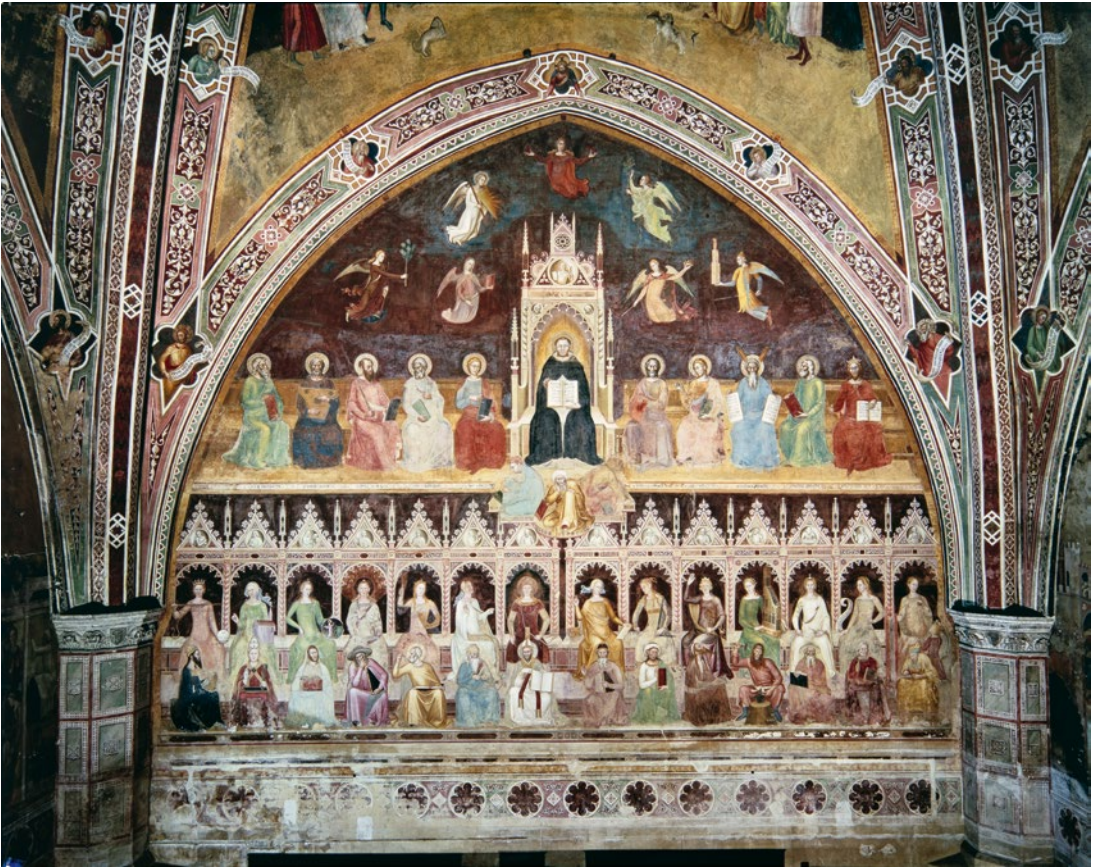
Abb. 2 Andrea da Firenze, Triumph Thomas von Aquins, 1365/67, Fresko, Florenz, Santa Maria Novella, Spanische Kapelle; linkes Fresko oben, in der untersten Reihe sitzen von links nach rechts Vertreter der artes et scientiae : »Civil Law/Justinian, Canonical Law/Clement V, Philosophy/Aristotle, Holy Scriptures/St. Jerome, Theology/St. John of Damascus, Contemplation/St. Dionysius, Preaching/St. Augustine; Arithmetic/Pythagoras, Geometry/Euclid, Astronomy/Ptolemy, Music/Tubalcain, 21 Dialectics/Pietro Ispano(?), Rhetoric/Cicero, Grammar/Priscian.« 22.

Nicht nur weist Prodenzani in der letzten cantica des Saporetto , »Mundus meritorius«, unter anderem auf Thomas von Aquin und dessen theologische Lehre hin – also just auf den Inhalt, der als Bildprogramm auch in der Spanischen Kapelle auf dem Fresko links dargestellt ist (Abb. 2) –, sondern die vier cantiche lassen sich zudem auf die Darstellung der vier menschlichen Lebensalter (Jugend, Erwachsenenalter, reifes Erwachsenenalter und Alter) auf den Innenwänden der Spanischen Kapelle übertragen. Neben den florentinischen Meistern scheinen insbesondere Kunstwerke aus Siena für ein breiteres Verständnis von Prodenzani nicht unwichtig; so besteht etwa eine augenfällige Referenzialität zum Fresko Il buon governo (1337–1340) in der Sala della Pace des Palazzo Pubblico von Ambrogio Lorenzetti (Abb. 3), in dem – in der christlichen Kunstgeschichte ein Novum – eine rein weltliche Herrschaft als Utopie dargestellt wird. 23 Auch in dieser allegorischen Darstellung der »guten Regierung« ( Buon governo ), die Tugenden