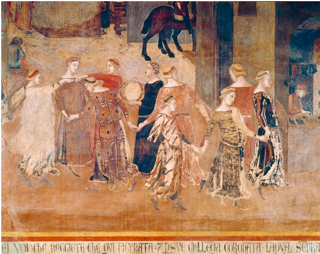
Abb. 3 Ambrogio Lorenzetti, Allegorie der guten Regierung (Buon Governo) , 1337–1340, Fresko, Siena, Palazzo pubblico, Sala della Pace, Detail mit Musik und Tanz ( carola ).

und Laster jetzt in einen profanen Kontext einbettet, ist eine friedliche Tanzszene zentral, ein Motiv, das auch im Liber Saporecti rahmengenend für die Handlung und gleichsam namensgebend für den Ort der Handlung wird: Wie die unter der guten Regentschaft zum Tanze motivierten Jungen in der Stadtvedute des Freskos kann auch der hochtalentierte buffone Sollazzo 24 am Hofe Buongovernos (!) Kunst auf höchstem Niveau zur Aufführung bringen. Der erzählerische Rahmen entspricht dabei ganz dem in enzyklopädisch angelegten literarischen Werken immer wieder zu beobachtenden, geradezu topoisierten Setting. Herweg, Kipf und Werle konnten so etwa zeigen, dass die didaktische Vermittlung von Wissen in solchen Texten durch das Prinzip der De- und Rekontextualisierung funktioniert: