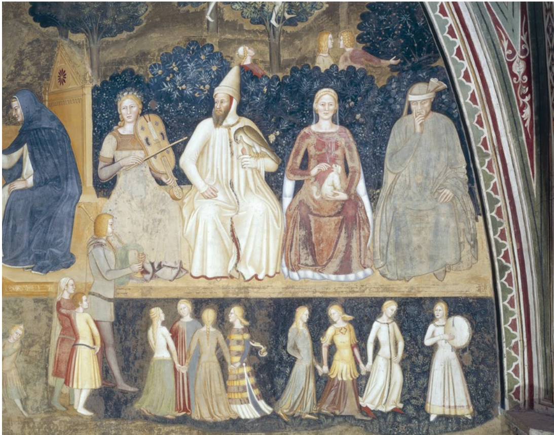
Abb. 1 Andrea da Firenze, Triumph der Kirche, 1365/67, Fresko, Florenz, Santa Maria Novella, Spanische Kapelle; rechtes Wandfresko, hier Ausschnitt aus dem »Weg der Erlösung«. Der Falkner verkörpert »Superbia«, die Dame mit Hund »Lussuria« und der Herr ganz rechts »Avaritia«.