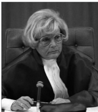
▲ Karin Graßhof 1989

Die ehemalige Richterin des Bundesverfassungsgerichts, Prof. Dr. Karin Graßhof, ist am 10. Juni 2025 im Alter von 87 Jahren verstorben. Sie hinterlässt ein beeindruckendes Erbe in der deutschen Rechtsgeschichte, insbesondere durch ihre bedeutenden Beiträge zum Wahlrecht und zur Rechtsprechung des Bundesverfassungsgerichts.