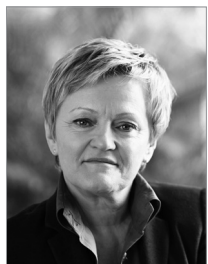
▲ Renate Künast, Foto: © Laurence Chaperon

Magwas: Parteien spielen schon rechtlich eine große Rolle, weil sie zuständig sind für die Aufstellung der Listen und für die Aufstellung der Direktkandidatinnen und Direktkandidaten in den Wahlkreisen. Allein deshalb muss auch das Thema Parität mitgedacht werden. Als Union haben wir uns auf den Weg gemacht, das Thema mit einer Quote zu regeln. Es hat eine Weile gebraucht, aber wir haben uns auf diese Quote verständigt, und das zeigt ja, dass das Thema für uns sehr wichtig ist. Es betrifft vor allem die Frage, welches Angebot wir an die Wählerinnen und Wähler machen möchten, aber es betrifft natürlich auch Fragen nach Strukturen oder welche Themen adressiert werden: Was Themen anbelangt, wie kommuniziert wird, wie miteinander umgegangen wird. Da machen eben auch Frauen einen Unterschied, wie wir ja auch im wirtschaftlichen Leben oft die positiven Unterschiede gemischter Teams sehen. Das personelle Angebot an die Wählerinnen und Wähler betrifft natürlich auch nicht nur Männer und Frauen, sondern auch jung und erfahren oder Menschen mit Migrationshintergrund, um nur einige weitere Felder zu nennen. Eine Liste oder auch Direktkandidatinnen und Direktkandidaten sollten so aufgestellt werden, dass sie ein gutes Angebot an die Wählerschaft darstellen. Die anderen Quoten stehen bei uns nirgends offiziell, aber faktisch gibt es diese ebenfalls, zumindest in Ansätzen.