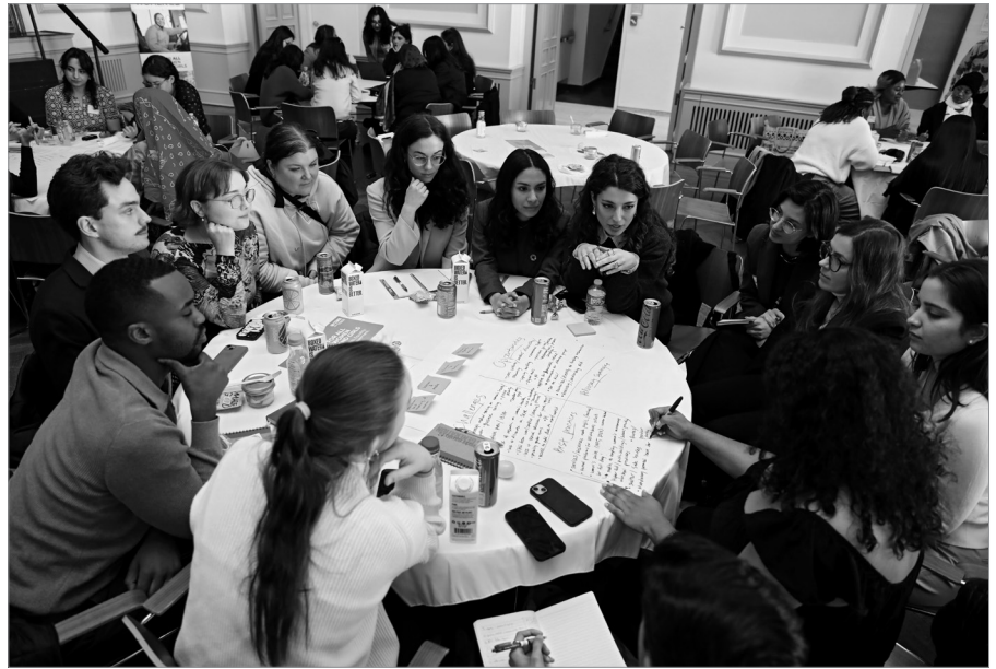
▲ Die Jugendbeobachterinnen beim Youth Forum von UN Women

Für uns startete die CSW69 bereits am Sonntag vor der offiziellen Eröffnung mit dem Youth Forum , einem Auftakttreffen für Jugenddelegierte und junge Aktivist*innen aus aller Welt. In gemeinsamen Gesprächen wurden erste Themen und Prioritäten abgestimmt, die uns während der gesamten Konferenz begleiteten, ergänzt durch regelmäßige Koordinationstreffen, Austauschformate und auch mal ein gemeinsames Abendessen oder einen Spaziergang durch die Stadt. Ein besonderes Highlight war unsere gemeinsame Rede beim High-Level Interactive Youth Dialogue am Freitag der ersten Woche, in der wir stellvertretend für junge Menschen aus Deutschland sprachen. Im Vorfeld der Konferenz wurde schnell deutlich: geschlechtsspezifische Gewalt, insbesondere in ihren neuen Erscheinungsformen wie digitaler Gewalt, ist für uns ein zentrales Anliegen. Genau dieses Thema stand im Fokus unserer Rede. Wir sprachen über die Zunahme und den strukturellen Charakter von Femi(ni)ziden, den besorgniserregenden Anstieg digitaler Gewalt und deren reale Auswirkungen auf das Leben von FLINTA-Personen weltweit.