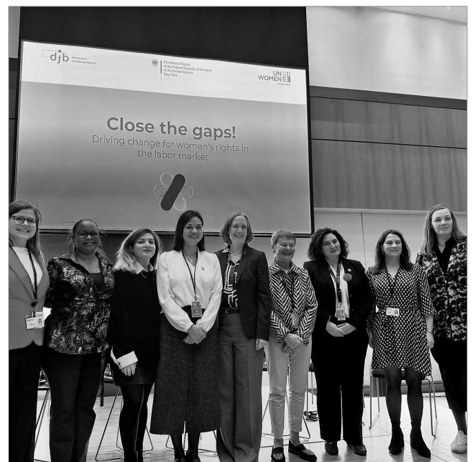
▲ Organisatorinnen und Podiumsteilnehmerinnen des Side Events „Close the gaps!“