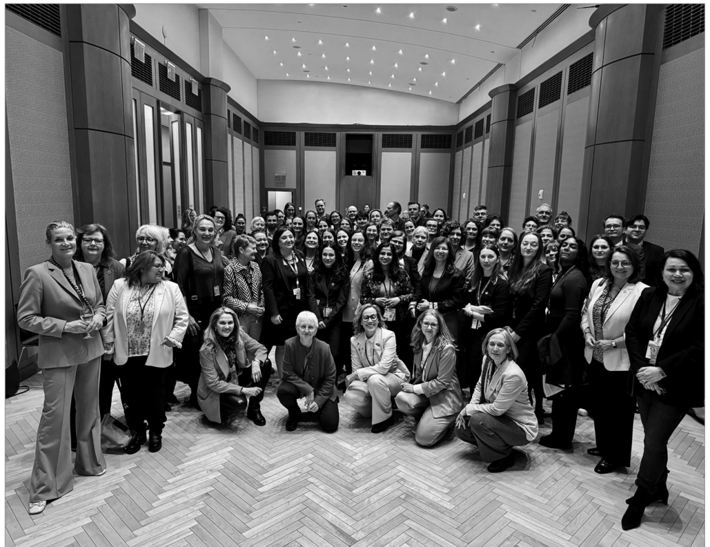
▲ Die Deutsche Delegation

Handeln mehr denn je. Wie UN-Generalsekretär António Guterres sagte: „There is an antidote. That antidote is action.“ Genau diese Haltung prägte die Konferenz – getragen von einer engagierten Zivilgesellschaft, die klar macht: Feministische Bewegungen weltweit lassen sich nicht aufhalten.