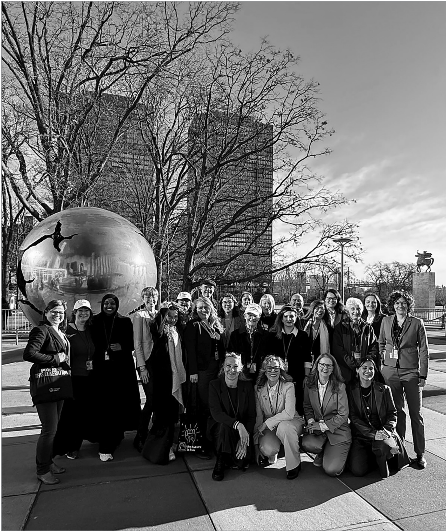
▲ Teile der Deutschen Delegation in New York