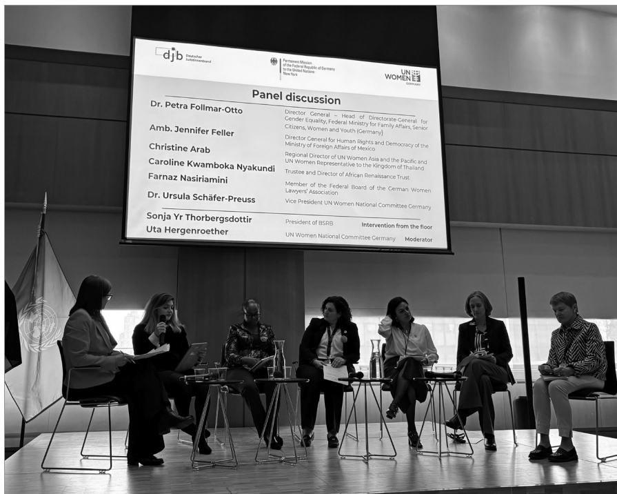
▲ Das Panel bei dem vom djb mitveranstalteten Side Event, Foto: privat