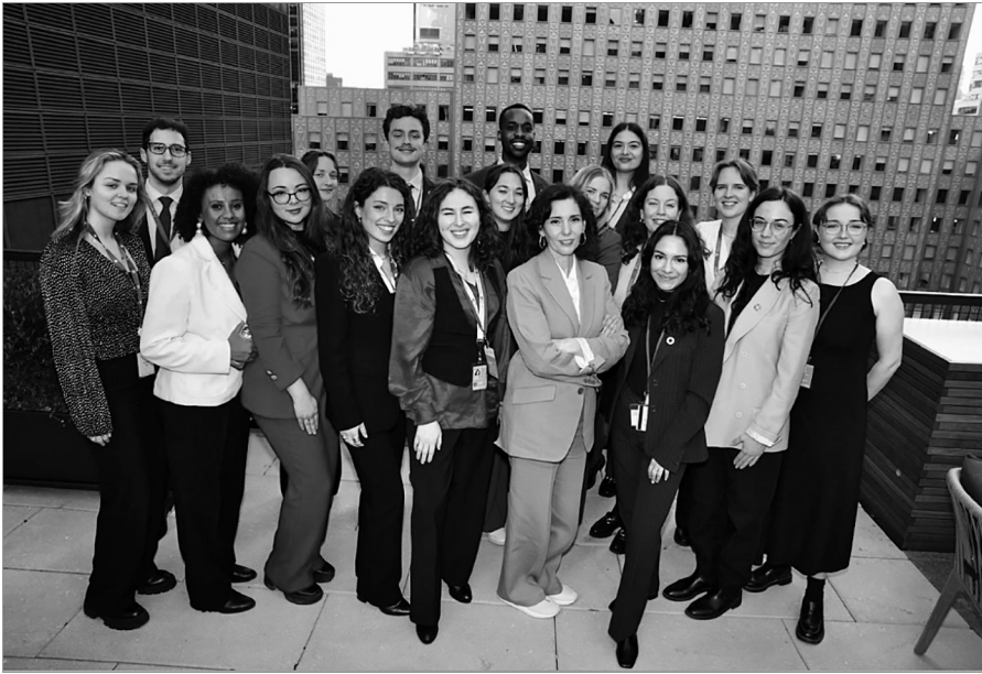
▲ Die Jugendbeobachterinnen mit Hadja Lahbib, Foto: Delegation der EU bei den Vereinten Nationen

das Jahr des Endspruchs für die Agenda 2030 – mit der drängenden Frage, welche Konsequenzen sich aus dem voraussichtlichen Verfehlen der Ziele ergeben. 2028 wird sich die Kommission mit Care- und Unterstützungsstrukturen befassen, 2029 mit der Lage von Frauen und Mädchen in humanitären Krisen.