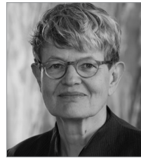
▲ Prof. Dr. Dr. h.c.