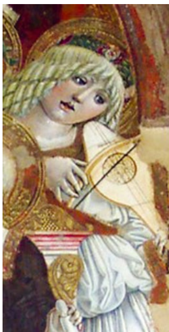
Abb. 21 Benvenuto di Giovanni di Meo del Guasta, Thronende Madonna mit Kind und musizierenden Engeln , ca. 1475, Tempera auf Holz, Ausschnitt, Murlo, Chiesa di S. Fortunato (Foto: Ufficio per i beni culturali ecclesiastici Siena).