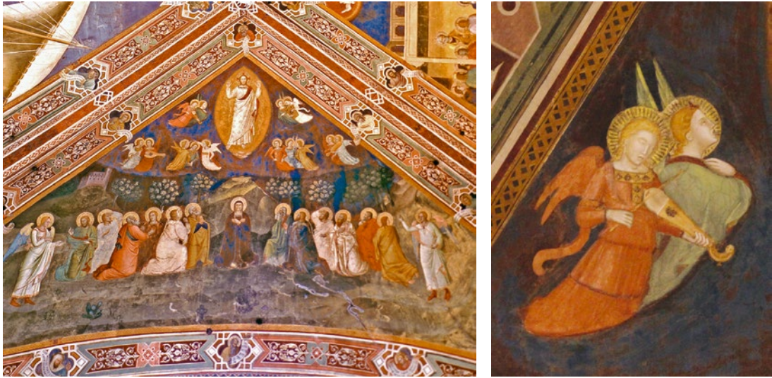
Abb. 1/2 Andrea di Bonaiuto, Himmelfahrt Christi , ca. 1365/67, Fresko, ganzes Bild und Ausschnitt, Florenz, Santa Maria Novella, Cappellone degli Spagnoli.