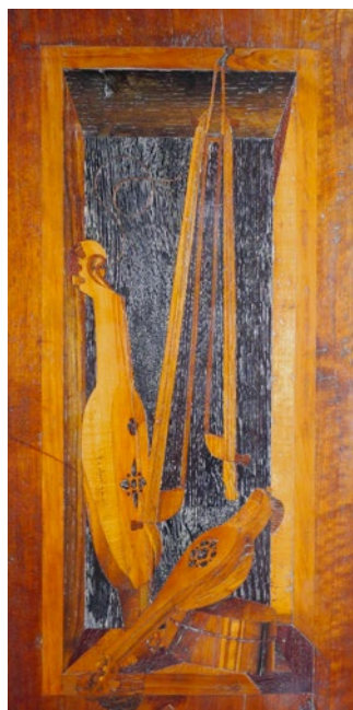
Abb. 20 Agostino de Marchi nach Francesco del Cossa, Stilleben mit zwei Rababs , 1479, Intarsie, Bologna, Basilica di San Petronio, Chorgestühl.