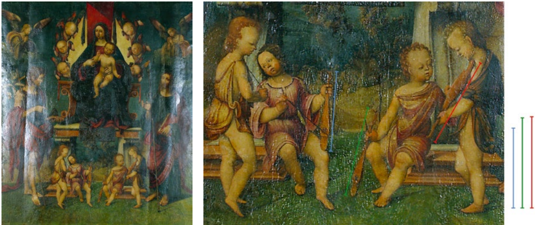
Abb. 31/32 Umkreis Lorenzo Costa, Thronende Madonna mit Kind, Johannes dem Täufer und dem Heiligen Jakobus , um 1500, Tempera auf Holz, Ganzes Bild und Ausschnitt (mit Längenvergleich), Diözese Faenza-Modigliana (mit Genehmigung des Ufficio Beni Culturali della Diocesi di Faenza-Modigliana).

Bei Engelskonzerten mit mehrfachen Darstellungen derselben Musikinstrumente sollte auf der inhaltlichen Ebene immer auch der Aspekt eines himmlischen Überflusses (lat. abundantia ) und auf der formalen Ebene das Prinzip der Vielfältigkeit (lat. varietas ) einbezogen werden. In Bezug darauf ist das bisher kaum bekannte und um 1500 datierte Gemälde einer Thronenden Madonna mit Kind, Johannes dem Täufer und dem Heiligen Jakobus aus dem Umkreis von Lorenzo Costa besonders interessant (Abb. 31 und 32). Im Unterschied zu den Engeln in der oberen Bildhälfte, die alle Flügel aufweisen, sind die vier leicht bekleideten musizierenden Knaben in der unteren Bildhälfte ohne diese dargestellt und erscheinen insgesamt viel ›irdischer‹, auch da sie mit den Füßen direkt auf der Erde stehen. Wie die beiden Rabab spielenden Engel in Abbildung 3 sind auch in diesem Gemälde die zwei äußeren Knaben von zwei unterschiedlichen Seiten gemalt. Dies hat hier allerdings zur Folge, dass man in der rechten Hand des Knaben ganz links zwar einen Streichbogen erkennen kann, das Instrument, bei dem nur vermutet werden kann, dass es sich ebenfalls um ein Rabab handelt, hingegen vollständig vom Oberkörper verdeckt wird. Die drei anderen Instrumente sind deutlich erkennbar und weisen übereinstimmend einen zungenartigen, konkaven unteren Deckenteil auf, der typischerweise mit Fell bespannt ist.