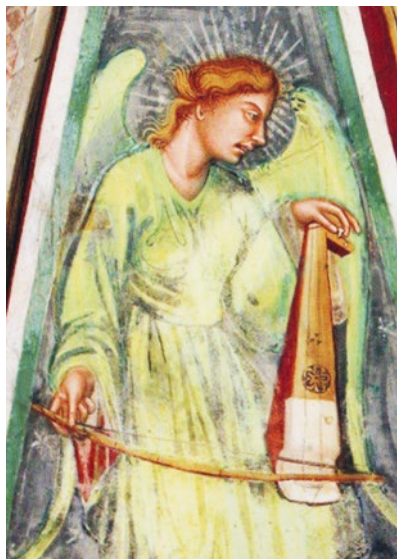
Abb. 15 Meister von Loreto Aprutino (zugeschrieben), Musizierende Engel, Propheten und Heilige , 1423, Wandmalerei, Ausschnitt, Offida, Chiesa di Santa Maria della Rocca, Kuppel (Foto: Fabio Marcelli, mit Genehmigung der Comune di Offida – Ufficio Cultura).