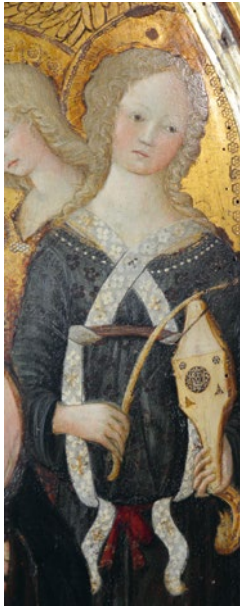
Abb. 23 Umkreis von Francesco di Giorgio Martini und Neroccio di Bartolomeo de' Landi, Madonna mit Kind und musizierenden Engeln , ca. 1475, Tempera auf Holz, Ausschnitt, Siena, Pinacoteca Nazionale, Inv.-Nr. 290 (Foto: Archivio Pinacoteca Nazionale di Siena, mit Genehmigung des Ministero della cultura).