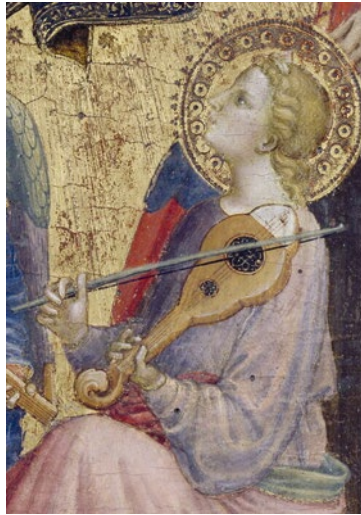
Abb. 18 Mariotto di Nardo di Cione, Madonna mit Kind, Heiligen und musizierenden Engeln , ca. 1415, Tempera und Gold auf Holz, Ausschnitt, Avignon, Musée du Petit Palais.