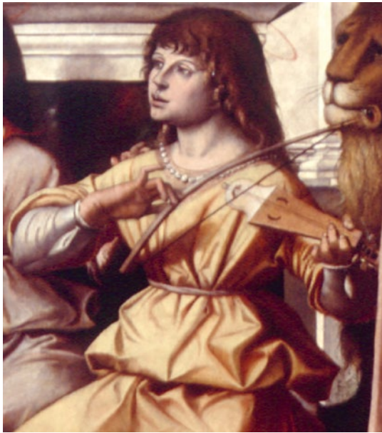
Abb. 27 Bartolomeo Montagna, Thronende Madonna mit Kind, Heiligen und musizierenden Engeln , ca. 1490, Öl und Tempera auf Holz, Ausschnitt, Certosa di Pavia, Museo della Certosa (mit Genehmigung des Ministero della Cultura – Direzione regionale Musei nazionali Lombardia – Certosa di Pavia).

die Felldecke nur aufgrund der konkaven Form vermutet werden kann, ist das Fell sonst aufgrund seiner Farbe klar unterscheidbar. Soweit erkennbar sind die Instrumente jeweils mit drei Saiten ausgestattet.