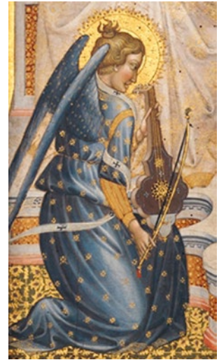
Abb. 19 Giovanni di Tano Fei, Marienkrönung , 1394, Tempera auf Holz, Ausschnitt, New York, Metropolitan Museum of Art.

Bei den folgenden Beispielen für den Subtyp II.II mit ovalem Korpus-Mittelteil lassen sich in Abbildung 20 eindeutig zwei Instrumentengrößen im selben Stillleben identifizieren: ein kleines und ein mittelgroßes Rabab. Beide Instrumente sind mit einer durch den konkaven unteren Deckenteil angedeuteten Felldecke, drei Saiten beziehungsweise drei Wirbeln und einer relativ großen Rosette im Mittelteil ausgestattet. Ebenfalls eine große Rosette weist das viersaitige Rabab in Abbildung 21 auf. Hier ist die Felldecke durch den fast weißen Farbton gut unterscheidbar, wobei der Steg irrtümlich statt auf der Felldecke auf dem hölzernen Mittelteil der Decke steht. Neben den Bildquellen ist für diesen Typus auch ein ins frühe 15. Jahrhundert datiertes Musikinstrument erhalten. Obwohl dieses im Metropolitan Museum in New York aufbewahrt und bisher ›Mandora‹ genannte kleine Instrument (Gesamtlänge circa 36 cm) im Lauf der Zeit einige Veränderungen erfahren hat, 10 ist der zungenartige, konkave, ursprünglich sicher fellbespannte untere Deckenteil deutlich sichtbar.