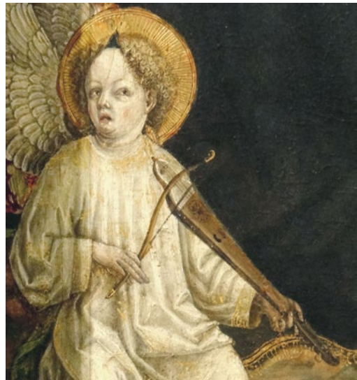
Abb. 30 Benedetto Bembo, Thronende Madonna mit Kind und Engeln , 1462, Gold und Tempera auf Leinwand (von Holz übertragen), Ausschnitt, Mailand, Museo d'Arte Antica, Pinacoteca.