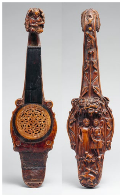
Abb. 22 Anonymus, Rabab, Italien?, ca. 1420?, Gesamtlänge ca. 36 cm, New York, Metropolitan Museum, Inv.-Nr.: 64.101.1409.