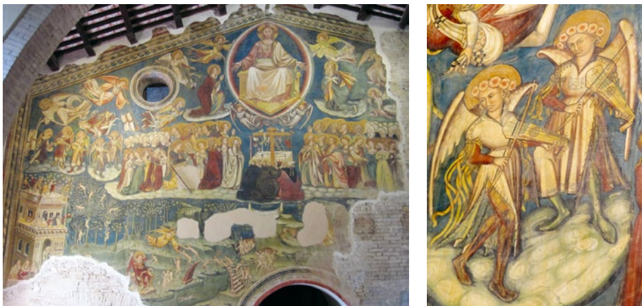
Abb. 13/14 Meister von Loreto Aprutino, Das Jüngste Gericht , nach 1429, Wandmalerei, ganzes Bild und Ausschnitt, Loreto Aprutino, Chiesa di Santa Maria in Piano.

Im ersten Drittel des 15. Jahrhunderts erscheint in den Rabab-Darstellungen des Meisters von Loreto Aprutino eine Variante der keulenförmigen Korpusform, die sich von derjenigen der Iberischen Halbinsel deutlich unterscheidet. Hier ist das untere Korpusende sehr breit und eher »eckig« (Abb. 13 und 14). 9 Die beiden im Jüngsten Gericht (nach 1429) »da braccio« gespielten Rababs sind eher mittelgroß. Das im Deckengemälde Musizierende Engel, Propheten und Heilige 1423 wahrscheinlich vom selben Meister in der Chiesa di Santa Maria della Rocca in Offida gemalte Instrument erscheint hingegen etwas größer. Obwohl das Rabab hier gerade »nur« gestimmt wird, handelt es sich aufgrund der mit der »da gamba«-Spielposition korrespondierenden Bogenhaltung im Untergriff sehr wahrscheinlich auch um die Spielhaltung (Abb. 15).