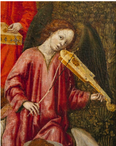
Abb. 25 Benedetto Bembo, Madonna mit Kind und musizierenden Engeln , 1464, Ausschnitt, La Spezia, Museo Civico Amedeo Lia (Foto: Federico Ratano, mit Genehmigung der Servizi Culturali Museo A. Lia).