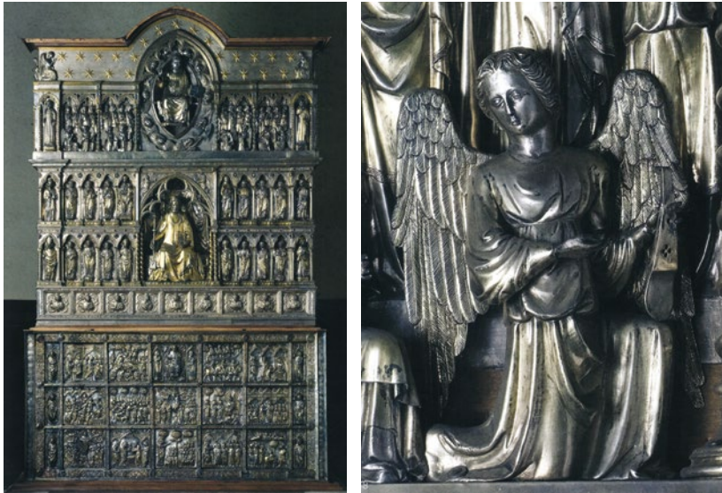
Abb. 11/12 Nofri di Buto und Atto di Piero Braccini, Majestas Domini mit musizierenden Engeln (oberstes Register des Jakobusaltars), 1395/98, Silber, ganzer Altar und Ausschnitt, Pistoia, Cattedrale di San Zeno, Cappella del Giudizio (mit Genehmigung des Ufficio Beni Culturali della Diocesi di Pistoia).

Im ersten Drittel des 15. Jahrhunderts erscheint in den Rabab-Darstellungen des Meisters von Loreto Aprutino eine Variante der keulenförmigen Korpusform, die sich von derjenigen der Iberischen Halbinsel deutlich unterscheidet. Hier ist das untere Korpusende sehr breit und eher »eckig« (Abb. 13 und 14). 9 Die beiden im Jüngsten Gericht (nach 1429) »da braccio« gespielten Rababs sind eher mittelgroß. Das im Deckengemälde Musizierende Engel, Propheten und Heilige 1423 wahrscheinlich vom selben Meister in der Chiesa di Santa Maria della Rocca in Offida gemalte Instrument erscheint hingegen etwas größer. Obwohl das Rabab hier gerade »nur« gestimmt wird, handelt es sich aufgrund der mit der »da gamba«-Spielposition korrespondierenden Bogenhaltung im Untergriff sehr wahrscheinlich auch um die Spielhaltung (Abb. 15).