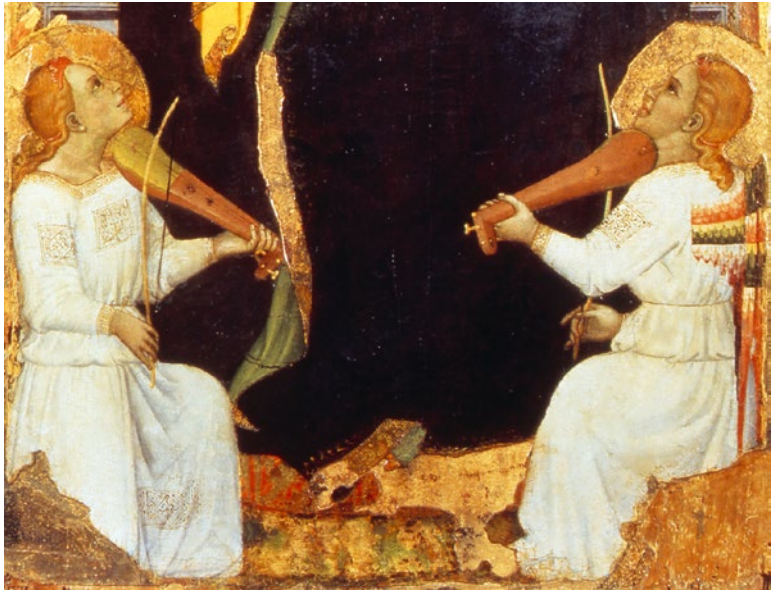
Abb. 3/4 Cecco di Pietro, Stillende Muttergottes mit musizierenden Engeln , um 1375, Tempera und Gold auf Holz, ganzes Bild und Ausschnitt, Pisa, Museo Nazionale di San Matteo, Inv.-Nr. 4897 (mit Genehmigung des Ministero della Cultura, Direzione regionale Musei nazionali Toscana, Firenze).