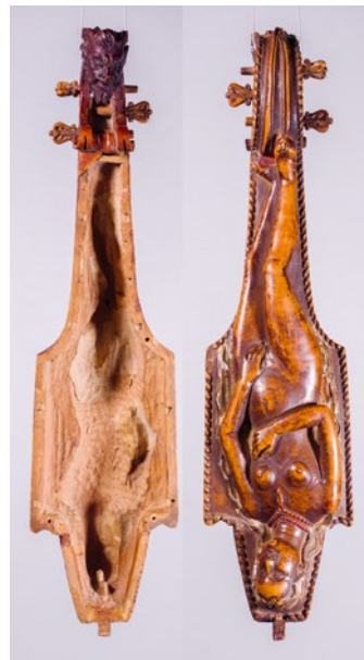
Abb. 26 Sog. Rebecchino, Fragment, Italien?, 15. Jahrhundert?, Gesamtlänge 36,9 cm, Kunsthistorisches Museum Wien.

Vom Subtyp II.IV mit trapezförmigem Mittelteil existieren ebenfalls mehrere Darstellungen in verschiedenen Größen (Abb. 27–30), wobei Bartolomeo Montagna anscheinend dasselbe Instrument zweimal aus verschiedenen Blickwinkeln gemalt hat. Bis auf Abbildung 29, in der