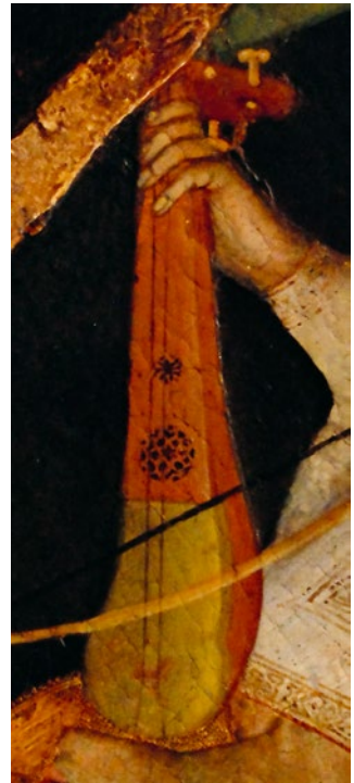
Abb. 5/6 Francesc Comes, Madonna mit Kind und musizierenden Engeln , ca. 1394, Gold und Tempera auf Holz, ganzes Bild und Ausschnitt (leicht gedreht). Ajuntament de Pollença, Museu de Pollença.