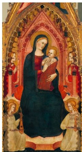
Abb. 8/9 Giovanni di Bartolomeo Cristiani, Thronende Madonna mit Kind, Heiligen und musizierenden Engeln , ca. 1380, Tempera auf Holz, Mitteltafel und Ausschnitte mit Hilfslinien, Florenz, Villa La Pietra.

Eindeutig unterschiedliche Rabab-Größen sind in einem auf ca. 1380 datierten Altarbild von Giovanni di Bartolomeo Cristiani erkennbar, dessen Mitteltafel eine Thronende Madonna mit Kind, Heiligen und musizierenden Engeln zeigt. Durch die eingezeichneten Hilfslinien lässt sich gut abschätzen, dass das linke Rabab ungefähr ein Drittel größer ist als das rechte (Abb. 8 und 9). Von den drei in der quantitativen Analyse genannten Rabab-Größen klein/mittel/groß, könnten es sich hier um die beiden Extreme handeln. Ein mittelgroßes und ein großes Rabab könnte hingegen in einer um 1395 entstandenen Thronenden Madonna mit Kind und musizierenden Engeln desselben Malers dargestellt sein (Abb. 10).