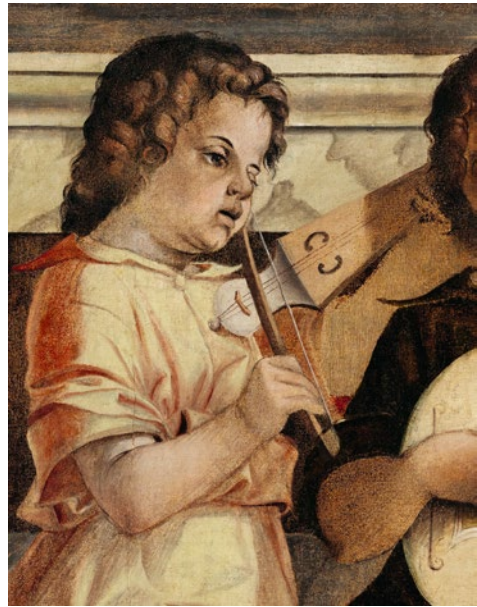
Abb. 28 Bartolomeo Montagna, Thronende Madonna mit Kind, Heiligen und musizierenden Engeln , ca. 1485, Öl auf Leinwand (von Holz übertragen), Ausschnitt, Vicenza, Museo Civico (Foto: Musei Civici di Vicenza – Museo Civico di Palazzo Chiericati, mit freundlicher Genehmigung der Musei Civici di Vicenza).