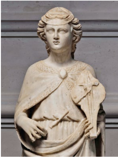
Abb. 17 Giovanni d'Ambrogio ( zugeschrieben), Musizierender Engel mit Rabab , ca. 1385/90, Marmorskulptur, Ausschnitt, Florenz, Museo dell'Opera del Duomo (Foto: Opera di S. Maria del Fiore, Florenz/ Carlo Vannini).

Die Abbildungen 17 bis 19 zeigen drei zwischen circa 1385 und 1415 entstandene Beispiele für den Subtyp II.I mit wolkenartigem Mittelteil. An allen drei Instrumenten ist die Felldecke entweder durch den konkaven untersten Deckenteil oder den Farbton eindeutig erkennbar. Besonders interessant ist das große, ›da gamba‹ gespielte dreisaitige Instrument in Abbildung 19. Bei dem an die Brust gestützten, ebenfalls dreisaitigen Rabab in Abbildung 17 scheint es sich um ein kleines und bei dem auf der Schulter gehaltenen viersaitigen Rabab in Abbildung 18 um ein mittelgroßes Instrument zu handeln.