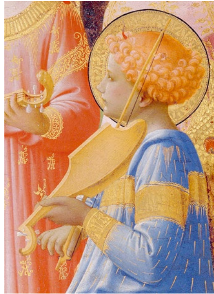
Abb. 24 Fra Angelico, Marienkrönung , ca. 1431, Ausschnitt, Paris, Musée du Louvre, Inv.-Nr. 314. (Foto: © GrandPalaisRmn, Musée du Louvre/Jean-Gilles Berizzi).