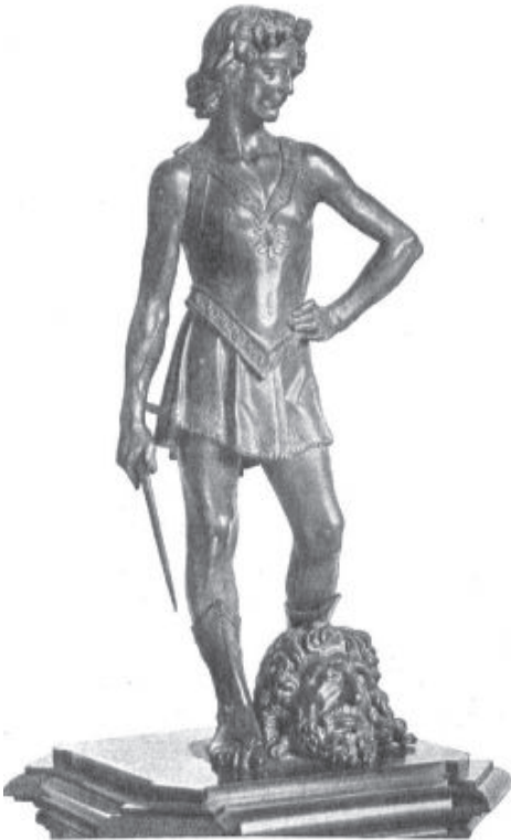
Abb. 2. David von VERROCCHIO. (Unrichtige Aufnahme.)