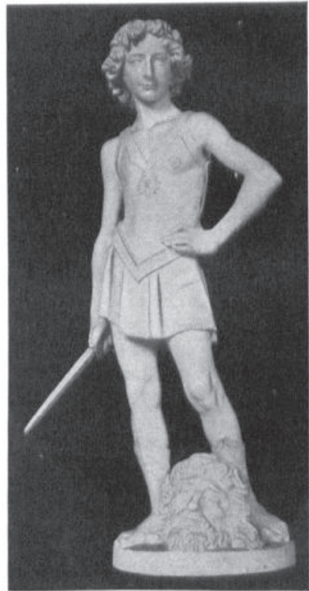
Abb. 3. David von VERROCCHIO. (Richtige Aufnahme.)

Abbildung: Heinrich Wölfflin: Wie man Skulpturen aufnehmen soll, in: Zeitschrift für Bildende Kunst, Folge 8, 1897.