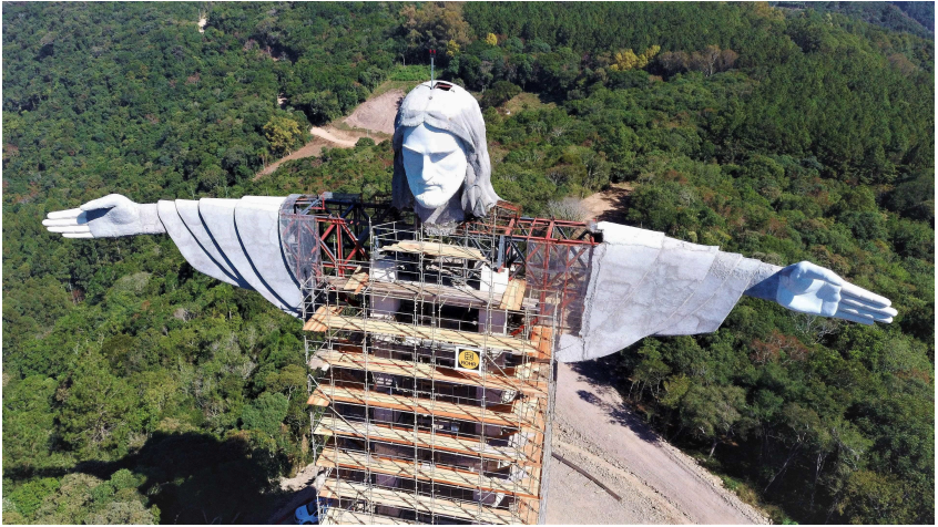
Abb. 1: Christusstatue Cristo Protetor, Encantado

Wir haben daher bewusst ein Bild gewählt, in dem die Christusfigur noch in Konstruktion und eine Baustelle war. Wie die Weltgesellschaft befinden sich auch die Kirchen und das Christentum in kritischen Transformationen und Umbauprozessen. Und wenn die Christen sich als „Leib Christi“, als Teil am Leib des Messias verstehen, dann markiert das Gerüst Umbauten an eben diesem Leib – gewissermaßen am Herzen und am Körper Christi, der im Sinne des „Christus totus“ bzw. des kosmischen Christus ein „queerer Körper“ ist, bestehend aus Menschen aller Geschlechter, Rassen, Schichten und Kulturen. Die ausgebreiteten Arme können andeuten, dass es bei diesen Umbauten um die Frage nach Rettung, Segen und Heil in einer von Krisen, Konflikten und Krieg zerrissenen Welt geht – dass das Christliche primär nicht eine Identität markiert, sondern eine befreiende Praxis des Evangeliums und eine messianische Hoffnung für die ganze Schöpfung.