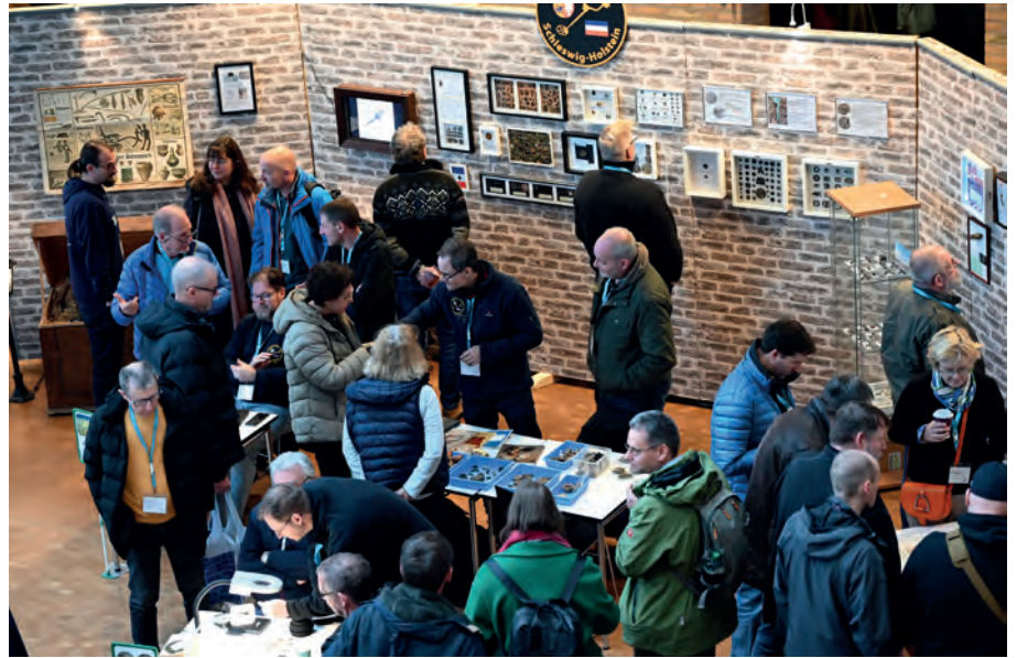
[ 3 ] Am Stand der Detektorgruppe nutzen viele Mitglieder den Tag der Archäologie zum Austausch.

Die Ausbildung selbst ist zweifellos aufwendig und bindet erhebliche personelle Ressourcen. Doch der Nutzen zeigt sich schnell: Gelingt es, tragfähige ehrenamtliche Strukturen aufzubauen, wird die oft knapp besetzte Archäologie deutlich gestärkt – zum Beispiel durch die Übernahme von Aufgaben als Vertrauensleute für die Bodendenkmale. Während diese Funktion früher vor allem historisch und heimatkundlich Interessierte übernahmen, kommen die neuen Vertrauensleute heute vielfach aus den Reihen der ausgebildeten Sondengängerinnen