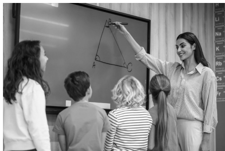
Digitale Smartboards sind in der Schule eher selten.

Wichtig für die Demokratie sind informierte Bürger*innen, allerdings sind wir über alle Altersgruppen hinweg von dieser Informationskompetenz noch weit entfernt. Wir können, so Gräßer, diese unglaubliche Informationsflut, das Wissen der Welt in der Hosentasche , noch nicht konstruktiv nutzen, sondern viele nutzen es eher, um sich desinformieren zu lassen. Einen guten Ansatz dagegen bietet die ARD: sie bietet einen Nachrichtentag an und lädt junge Menschen ein, selbst Nachrichten zu machen. So etwas kann man auch leicht in den Unterricht integrieren, indem beispielsweise Schüler alle Zeitungen des Tages zur Verfügung gestellt bekommen und daraus eine Viertelstunde Nachrichten zusammenstellen sollen. Schon dadurch lernt man, dass man die Masse an Informationen verdichten muss, dass man Prioritäten setzen muss in dem, was wichtig für einen selbst wichtig ist und was nicht. Man sieht, dass sich Aussagen und Positionen widersprechen, zu denen man sich positionieren muss.