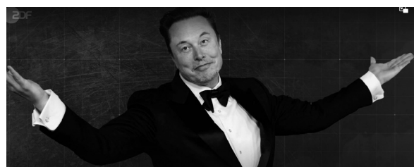
Will nun auch in der Politik mitmischen: Elon Musk

Dazu Pörksen: „Ich würde in der Tat sagen, wir beobachten hier, dass etwas entstehen könnte, was man eine Unternehmer-Oligarchie nennen könnte, eine Herrschaft der ganz wenigen Mächtigen. Und wir haben ja gesehen, mit dem Kauf von Twitter-Acts durch Elon Musk: also die Plattform hat sich in ein total toxisches Klima verwandelt. Rassistische Äußerungen, antisemitische Postings, Attacken auf Transmenschen, Verschwörungsmysmen, all dies bleibt stehen oder wird vom Chef höchstpersönlich unter Umständen promotet. Also Elon Musk hat ja seine Ingenieure gezwungen,