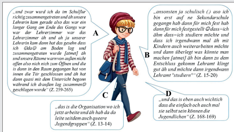
Abbildung 1: Typus ‚Queeres Engagement als Verstärkung von Handlungsfähigkeit und Emanzipation von biographischer Fremdbestimmtheit‘