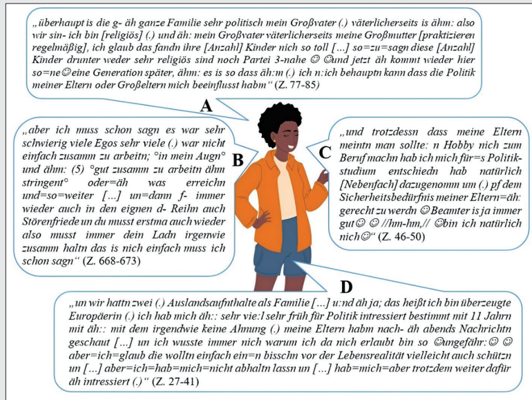
Abbildung 3: Typus ‚Queeres Engagement als Weiterführung familialer Grundhaltungen‘