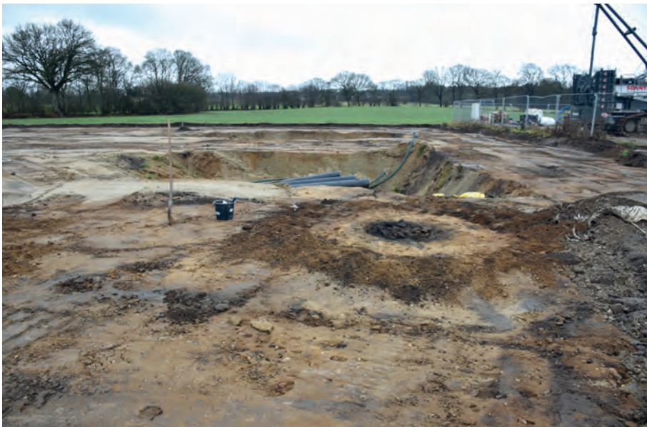
[6] Kochsteingrube, Befund 102, im Anschlussbereich der Trasse an den Düker bei der Startgrube.