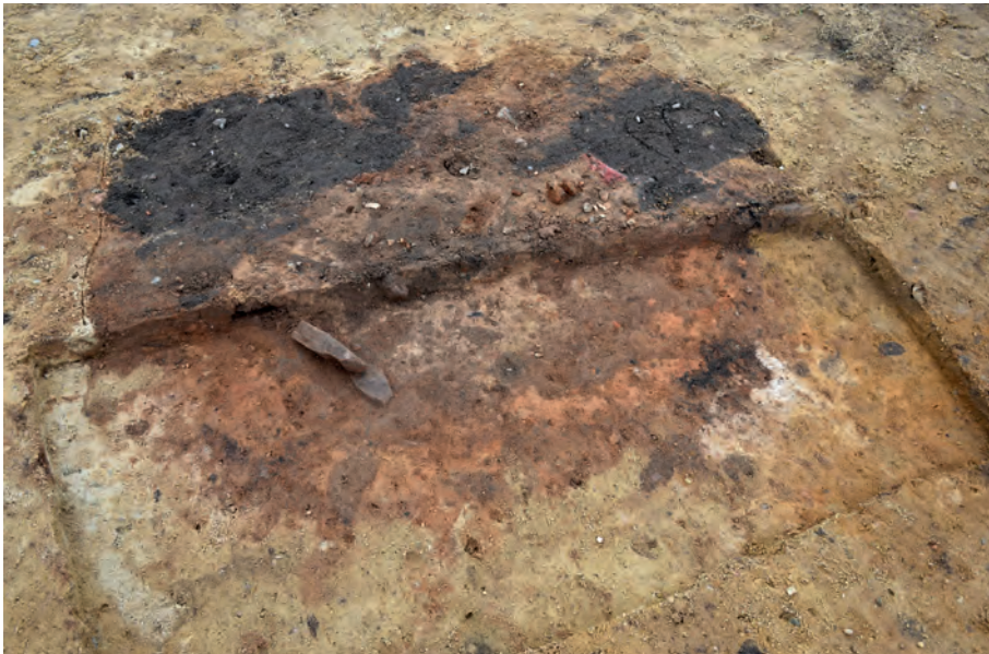
[5] Ofenbefund Befund 3 im PLANUM 2 mit Profilsteg, Siedlungsrandbereich Düker Startgrube am »Henstedter Baum«.