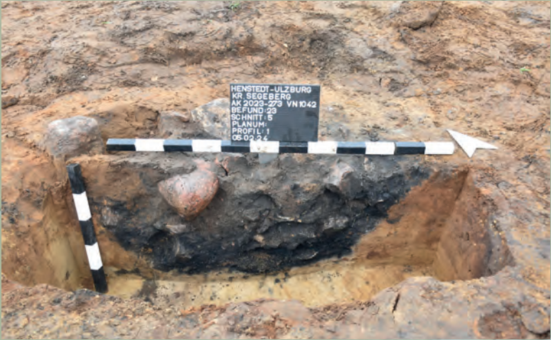
[ 3 ] Kochsteingrube Befund 23 im Profil, zu sehen ist die Steinpackung über einer Holzkohlen- und Aschelage.